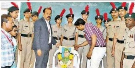
నేతాజీ సుభాష్ చంద్రబోస్ చిత్రపటానికి పూలమాల వేసి నివాళులల్పిస్తున్న దృశ్యం